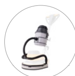
Gruppo aspirante (optional)