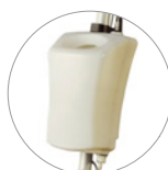
Serbatoio 12 litri (optional)