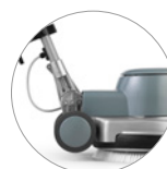
Snodo del manico