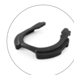
Possibilità uso peso aggiuntivo (optional)