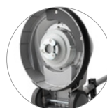
Attacco disco trascinatore e spazzole