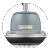
27% di plastica riciclata