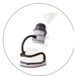
Kit de succión (opcional)