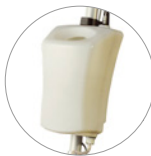
Depósito de 12 l (opcional)