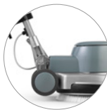
Articulación de la palanca