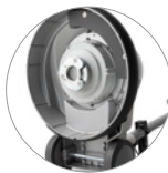
Ataque para porta pads y cepillos