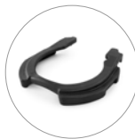
Posibilidad de uso peso adicional (opcional)