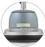
27% de plástico reciclado