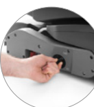
Tres niveles de presión al suelo seleccionables