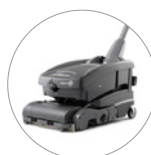
17% de plástico reciclado