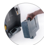
Baterías al litio