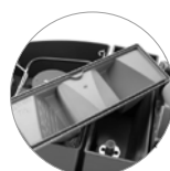
Depósito estanco de solución con función de dosificación de detergente