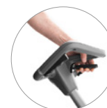
Manillar ergonómico con sistema de desenganche (patentado)