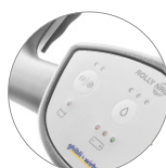
Función en modalidad silenciosa